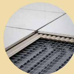
Vloer isolatie en renovatie