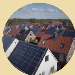
Zonnepanelen Komt enkel in aanmerking voor Mijn VerbouwLening.