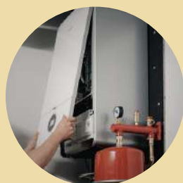
Gascondensatieketel Komt enkel in aanmerking voor Mijn VerbouwLening.