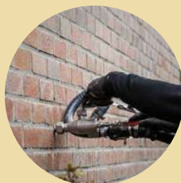
Buitenmuur isolatie en renovatie