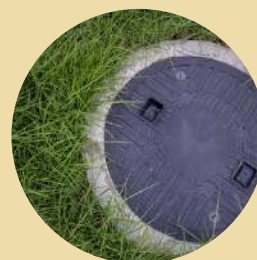
Elektriciteit sanitair en regenwaterrecuperatie