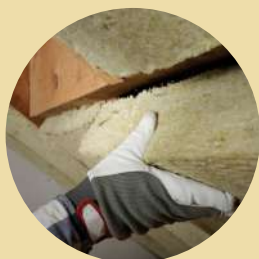
Dak isolatie en renovatie

Mijn VerbouwPremie en Mijn VerbouwLening is er voor deze ingrepen